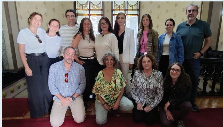
5º encontro de parceiros do projeto (na Roménia)

Entre os dias 26 e 27 de setembro, realizou-se na Roménia o 5º e último encontro de parceiros do projeto ERASMUS+