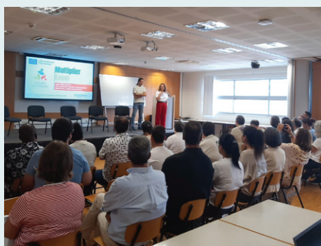
Multiplier Event do projeto All Sustainable

Em breve, serão divulgadas mais novidades sobre os resultados e a disponibilização gratuita dos recursos para o público. Fiquem atentos para saberem como podem fazer parte de um futuro mais inclusivo e sustentável!